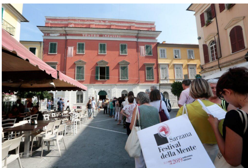
Festival della Mente 2019