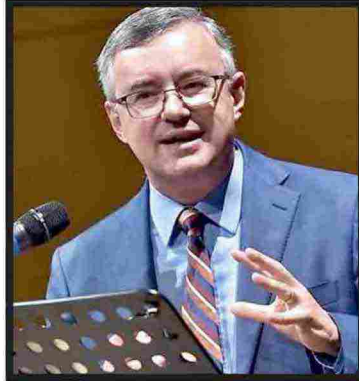
Tutto esaurito assicurato per l'ennesimo appuntamento con Alessandro Barbero: si parlerà del delitto Matteotti