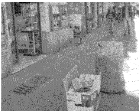
DECORO Scatoloni e sacchi della spazzatura lasciati in mezzo a via Mazzini ieri mattina

ra portato all'individuazione dei responsabili e alle relative sanzioni. Un «dossier» realizzato dagli operatori di Acam sugli abusi è stato ora inviato all'amministrazione comunale per i provvedimenti conseguenti. Nella relazione le fotografie e gli elementi raccolti nelle «isole ecologiche» più soggette a scarichi abusivi: Porta Parma, piazza Martiri, viale della Pace e viale XXI Luglio. Sembra che gli operatori, attraverso l'esame dei rifiuti abbandonati in strada accanto ai cassonetti vuoti abbiano individuato anche i responsabili.