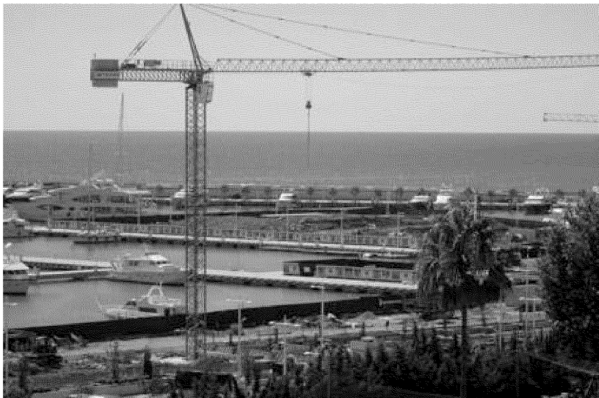
Il nuovo porto di Imperia è da mesi sotto i riflettori, oggetto di forti polemiche politiche