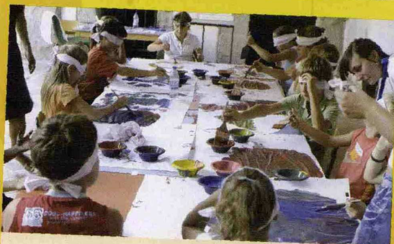
Sarzana / La Spezia