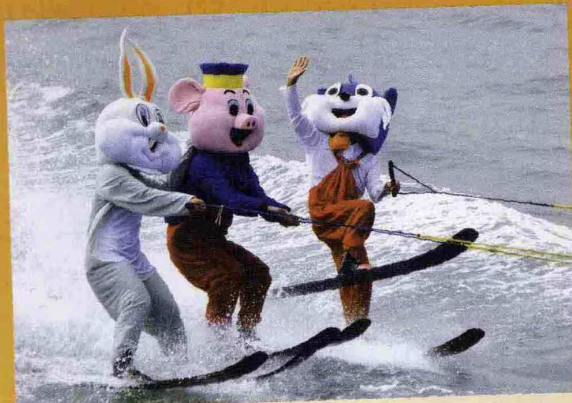
Qingdao / Cina