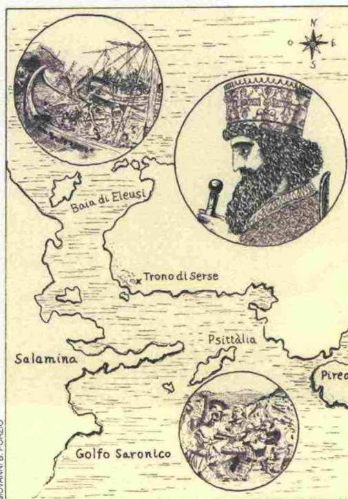
Sopra, una mappa con i principali scenari della battaglia. Nel tondo, un profilo del re persiano Serse, il grande sconfitto

S ALAMINA. Paura e panico. La storia della guerra con cui duemila e cinquecento anni fa, proprio sul finir dell'estate, i Greci respinsero le immense forze persiane guidate dal re Serse si conclude con una battaglia dominata interamente da paura e panico. La paura spinge gli umani a considerare con attenzione le proprie possibilità. Il panico, al contrario, fa cadere gli uomini in un abisso che può rivelarsi senza fine e segue generalmente una inutile baldanza, se non lo spregio della paura stessa. All'inizio di tutto però non ci sono uomini ma un cane e la sua paura. È il cane del padre di quello che sarebbe diventato il grande statista della generazione seguente: Pericle. Non sappiamo come si chiamasse ma divenne un modello quando il suo padrone, Santippo, lo salutò abbandonando Atene ormai deserta. Incapace di accettare l'abbandono, il cane si tuffò, seguì con tutte le sue forze l'imbarcazione e nuotò fino a Salamina, senza mai lasciarsi prendere dal panico. Fu la fatica a ucciderlo. Santippo e i suoi compagni eressero una tomba in sua memoria. Gli antichi chiamavano il luogo Cinossema, tomba del cane. Il primo eroe della battaglia decisiva.