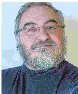
Il linguista Andrea Moro

E infatti, questa classifica di lingue e quindi persone di serie A e serie B, poteva mancare