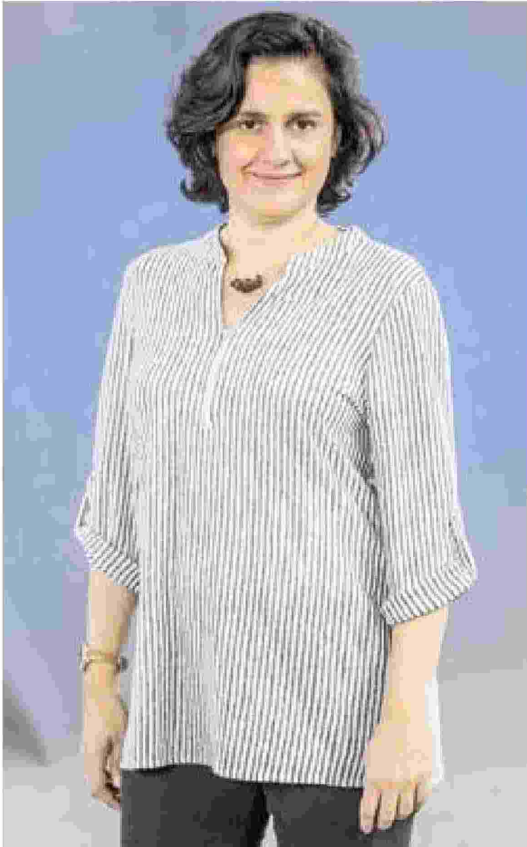
La scrittrice Kamila Shamsie, nata a Karachi nel 1973. Vive a Londra