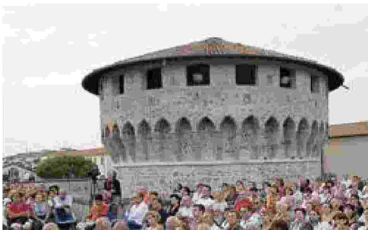
La Fortezza Firmafede sarà la location di alcuni eventi