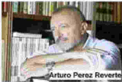
Arturo Perez Reverte