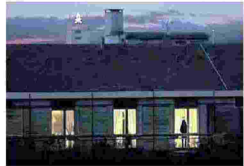
Un'immagine dal trailer del docufilm "Un altro domani"

IL 2 SETTEMBRE SARÀ PRESENTATO AL FESTIVAL DELLA MENTE DI SARZANA IL REGISTA ANTICIPA IL PROGETTO DI UN LAVORO CON IL FRATELLO VELISTA