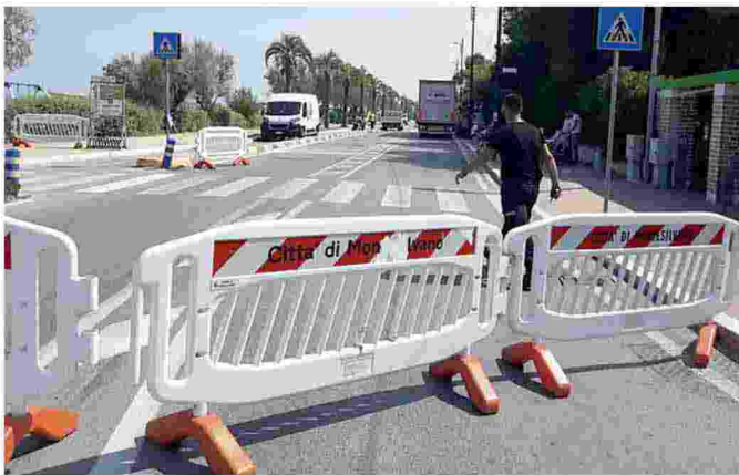
Le transenne posizionate all'altezza di via Marinelli