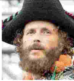
Lorenzo Cherubini, in arte Jovanotti