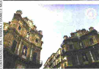
CONTRASTO/IPA / MARCA / DANIELE MIOGGIA