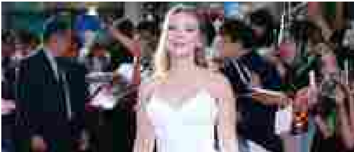
Scarlett Johansson è l'attrice che ha fatto incassare di più nella storia