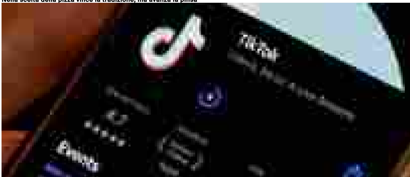
TikTok sarebbe al lavoro per una versione Usa del social