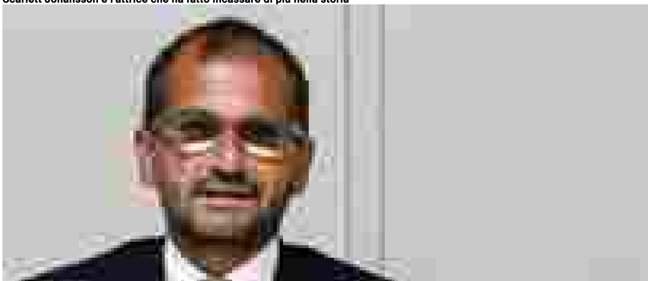
Gemmato, '620 milioni in più alla farmaceutica dal 2026'

Ritaglio stampa ad uso esclusivo del destinatario, non riproducibile.